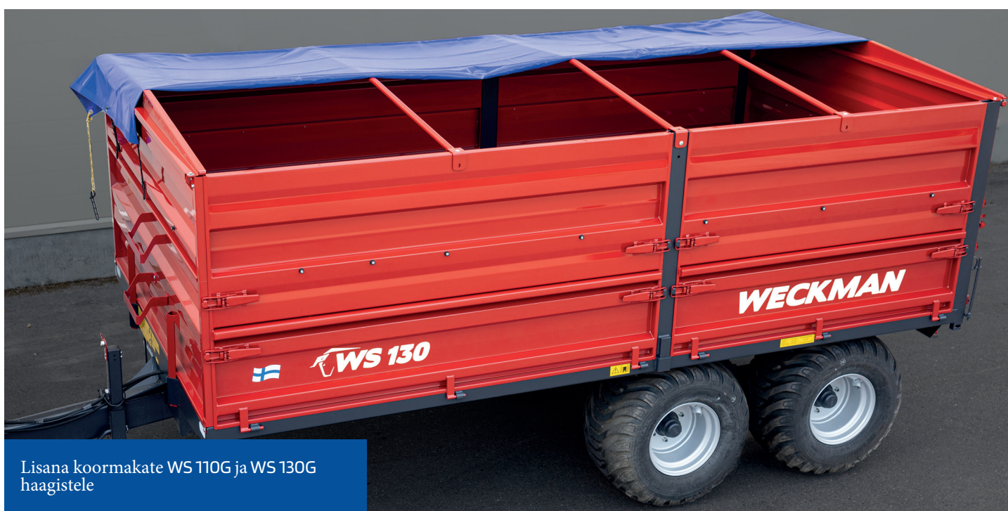
Lisana koormakate WS 110G ja WS 130G haagistele

Ruloonihaagised – tööriistakast, varustus kiirusklassile 50 km/h