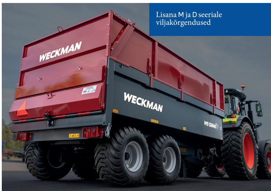
Lisana M ja D seeriale viljakõrgendused